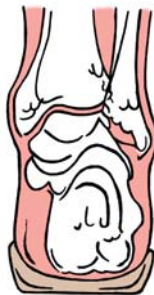
Стелька-супинатор ПЕРСЕЙ-ОРТО возвращает стопу в нормальное состояние и поддерживает ее